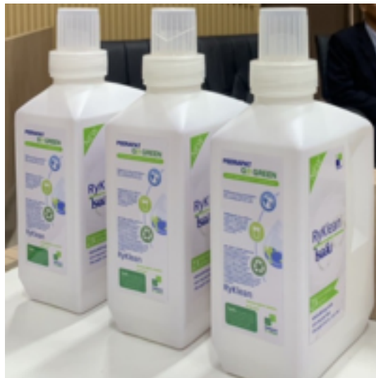
รูปผลิตภัณฑ์ซักผ้าต้นแบบการนำน้ำจากกระบวนการรีไซเคิลมาใช้ในการผลิตผลิตภัณฑ์