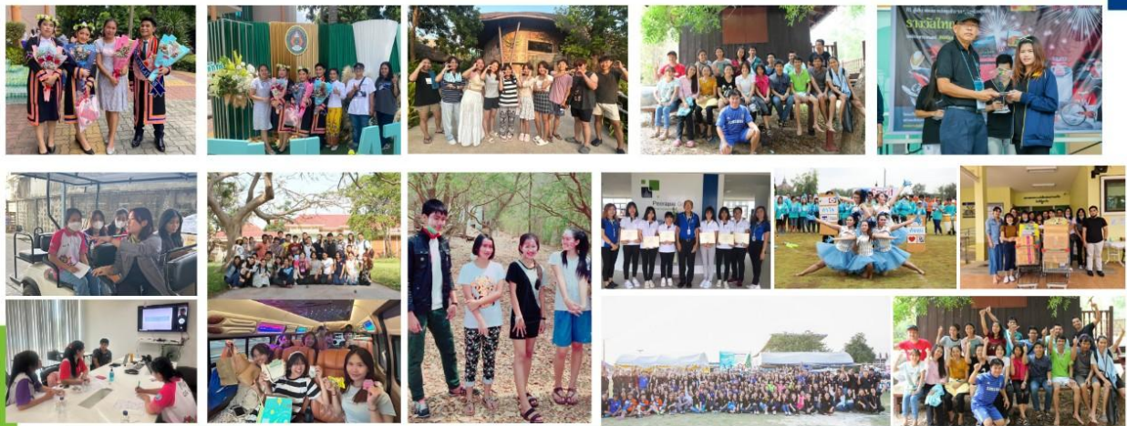
บริษัท พีรพัฒน์ เทคโนโลยี จำกัด (มหาชน)