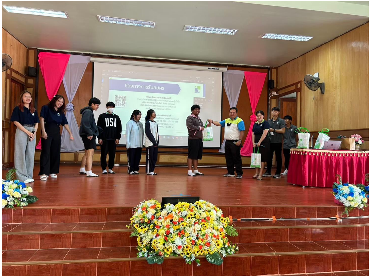
ภาพบรรยากาศรุ่นพี่เข้าแนะแนวรุ่นน้อง