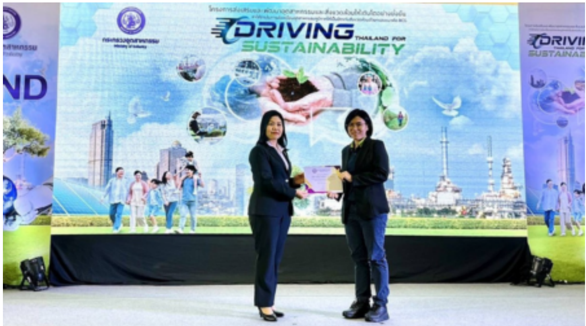
รับมอบเกียรติบัตร โครงการ DRIVING THAILAND FOR SUSTAINABILITY