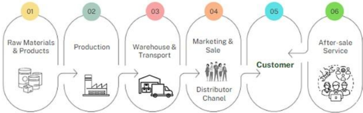
การจัดการผลกระทบต่อผู้มีส่วนได้เสียในห่วงโซ่คุณค่าทางธุรกิจ