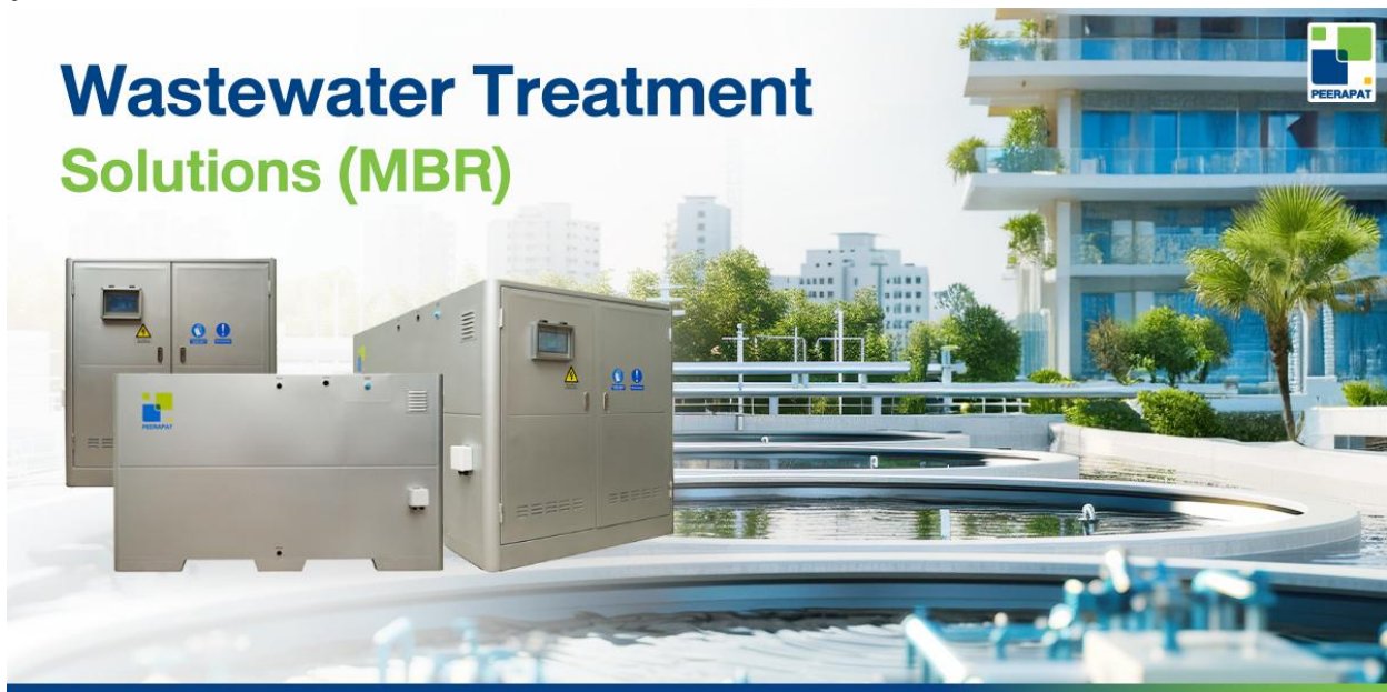
รูปภาพ8) ผลิตภัณฑ์ระบบบำบัดน้ำเสีย Membrane Bioreactor (MBR)

PRAPAT เป็นผู้นำเข้าและจัดจำหน่ายผลิตภัณฑ์ระบบบำบัดน้ำเสีย Membrane Bioreactor (MBR) ภายใต้ตราสินค้า “PEERAPAT” ซึ่งเป็นระบบเทคโนโลยีการบำบัดน้ำเสียแบบ Biological Treatment + Membrane Filtration สำหรับน้ำเสียชุมชนและน้ำเสียอุตสาหกรรม โดยใช้การเลี้ยงจุลินทรีย์ในถังเติมอากาศร่วมกับการกรองด้วย membrane โดยตัดขั้นตอนตกตะกอนออกไป ส่งผลให้ระบบมีขนาดเล็กลง ได้น้ำที่ทั้งคุณภาพสูง สามารถนำน้ำกลับมาใช้ใหม่ได้ ทำให้ระบบบำบัดสามารถช่วยผู้ประกอบการลดค่าใช้จ่ายในการใช้น้ำประปา และประหยัดค่าใช้จ่ายในการทิ้งตะกอนส่วนเกิน เหมาะสำหรับการใช้ในอุตสาหกรรมการให้บริการ (Hospitality Industry) อาทิ กลุ่มธุรกิจโรงแรม รีสอร์ท โรงพยาบาล ร้านอาหาร คริวกลาง และโรงงานอุตสาหกรรมอาหารขนาดเล็ก เป็นต้น