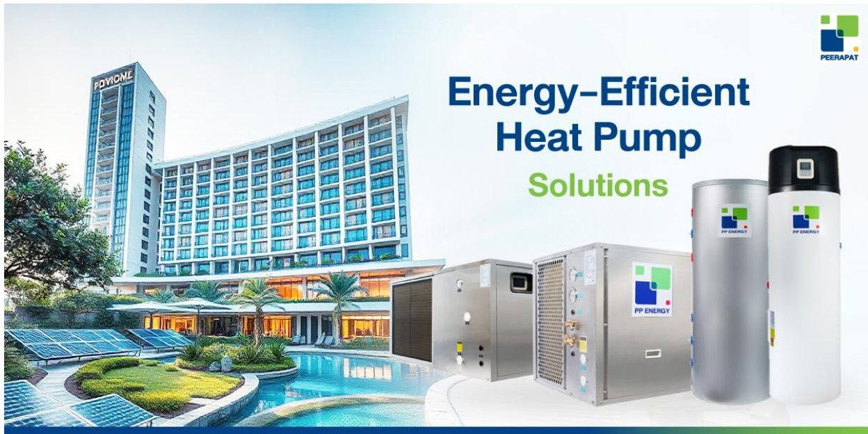
รูปภาพ7) ผลิตภัณฑ์เครื่องทำน้ำร้อนประหยัดพลังงาน